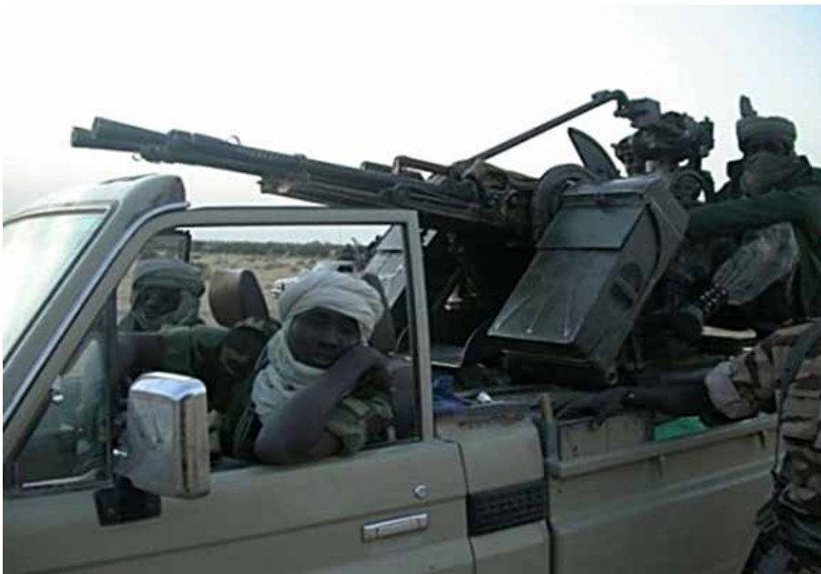
Figure 3. Soldats tchadiens, Tchad, 2008.

Le Tchad a été un acteur constant et actif dans la région, notamment en RCA voisine. Les forces nationales tchadiennes (fig. 3) ont été déployées en RCA dès 1997 dans le cadre de la première force multinationale africaine (MISAB) qui a intervenu avec un soutien militaire français important pour rétablir la paix et la stabilité dans Bangui, la capitale déchirée par la guerre 12 . Les soldats tchadiens ont mené plusieurs opérations en RCA au cours des dix-sept dernières années. La République centrafricaine se trouve en fait dans l'arrière-cour stratégique du Tchad. Pour diverses raisons, l'instabilité qui règne à Bangui peut facilement ouvrir la voie à un brutal changement de régime à près de mille six-cents kilomètres de là, à Ndjamena, la capitale du Tchad. Par conséquent, la stabilité politique interne du Tchad et celle de la RCA sont étroitement liées depuis un demi-siècle.