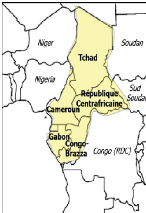
Figure 1. Ancienne Afrique équatoriale française au XX e siècle. (avec l'autorisation de l'auteur)

L'Afrique a radicalement changé pour le mieux au cours des dix dernières années. Les processus démocratiques, la bonne gouvernance et le développement économique progressent maintenant dans de nombreux pays. Pourtant, une partie du continent est secouée par la polarisation traditionnelle ethnique, la corruption généralisée, le manque d'éducation, la pauvreté et les inégalités sociales : « Ces éléments se recoupent et sont fréquemment manipulés par les politiciens 1 ». Ils favorisent souvent les violences brutales et les changements de régime sanglants. En effet, le conflit de 2013 en République centrafricaine (RCA) dévoile une image déjà vue au Nigeria, en République démocratique du Congo (fig. 1), en Côte d'Ivoire et en Libye, pour ne citer que quelques pays. Cette image reflète des siècles de méfiance entre les communautés ethniques ou tribales, ainsi qu'une fracture sociale et une pauvreté qui affectent une grande partie de la population 2 .